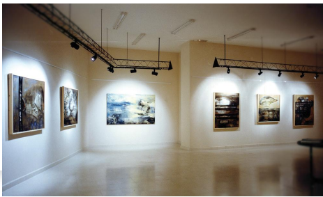
Sala de Exposiciones del Banco Central Hispano.