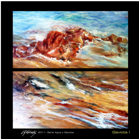
"Gaviota 1". Serie "Agua".

Y no terminaremos sin resaltar un detalle que no solemos comentar habitualmente: los precios de las obras de CSViñuales son ajustados, aptos para tiempos de crisis, apreciándose ahí la faceta empresarial de la autora que prefiere adaptarse a la realidad de la situación actual que involucrarse en el divismo que se ve con excesiva frecuencia".