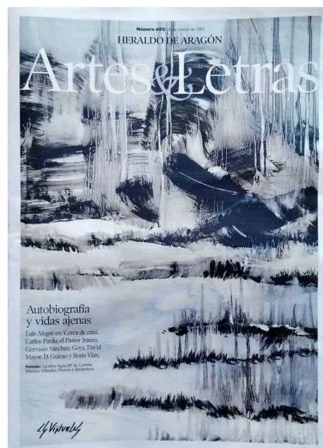
Portada "Artes y Letras". Heraldo de Aragón, num. 485. 8 de Enero 2015.

"... CSViñuales es diseñadora gráfica y una pintora muy expresiva que trabaja, muy especialmente, los paisajes tempestuosos y enérgicos. Aquí son casi todos marinas, pero no marinas amables o suaves, sino más bien violentas. Bajo el oleaje o la oscilación de las mareas, en ocasiones, parecen asomar criaturas terribles o no tan terribles, peces informes, peces sugeridos, saurios. Monstruos. Y entre sus animales, en uno de los cuadros más vigorosos, parece intuirse un toro que se desmeleno...".