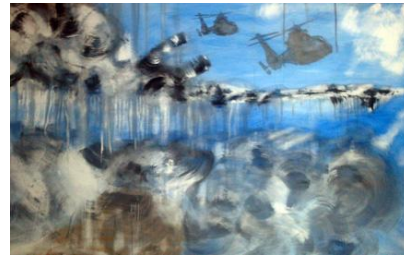
"Después del último día".

"Experimental y autodidacta en sus cuadros, se siente cómoda entre formatos grandes, el óleo sobre madera y creación de volúmenes a partir de capas. La técnica se basa en la abstracción intuitiva trabajando en varias piezas a la vez y concretando después en cada una de ellas bajo la temática común que define la serie, es por ello, por lo que suelen aparecer composiciones inesperadas de dipticos y múltiples entre sus obras".