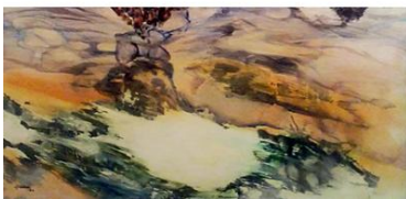
"Agua 1". Serie "Agua". Paisaje subacuático.