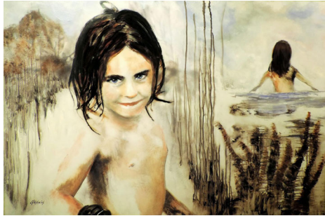
"Purity 2". Serie: 404 Error". Óleo s/ madera. 120 x 80 cm.

A partir de aquí todo cambia en los cuadros titulados, por ejemplo, "Not found", "Después del último día", "Broken" y "Calm", que son atractivos paisajes expresionistas con aves y helicópteros que según la pintora son símbolo de rescate. También a resaltar la suelta técnica, clave para el tono expresivo que fusiona mediante ágiles trazos y planos irregulares".