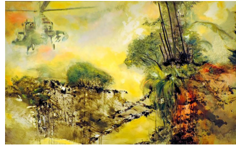
"Not found". Serie: 404 Error". Óleo s/ madera. 120 x 80 cm.

Esencia de la pureza, inocencia o maldad gratuita, se muestran de una manera muy sutil en sus pinturas..."