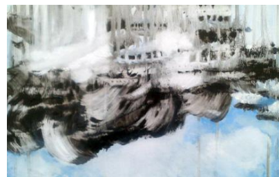
"Después del último día 2".