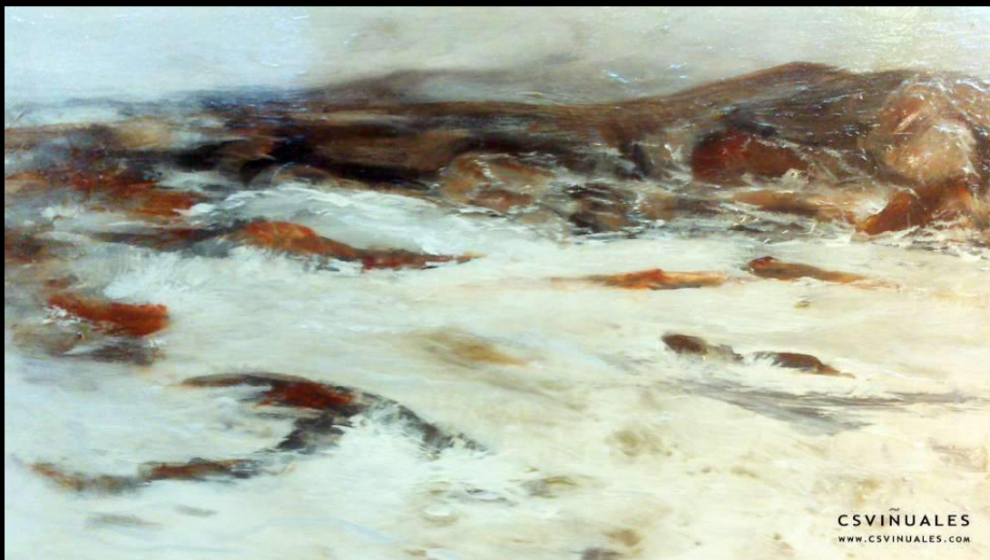
5. Gaviota II Óleo y Mixta s/lienzo - Oil and Mixed on canvas 0,60 x 0,60 cm.