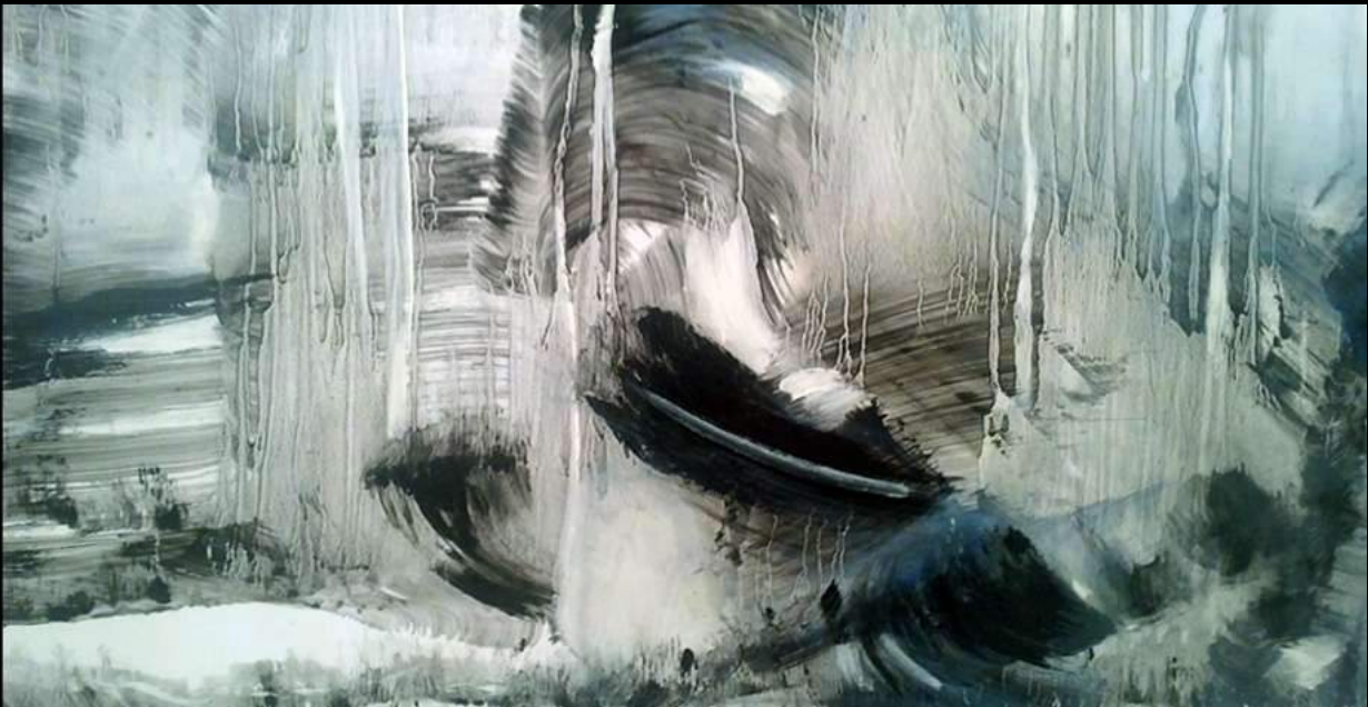
7. Agua IV Óleo s/madera - Oil on wood 0,60 x 0,60 cm.