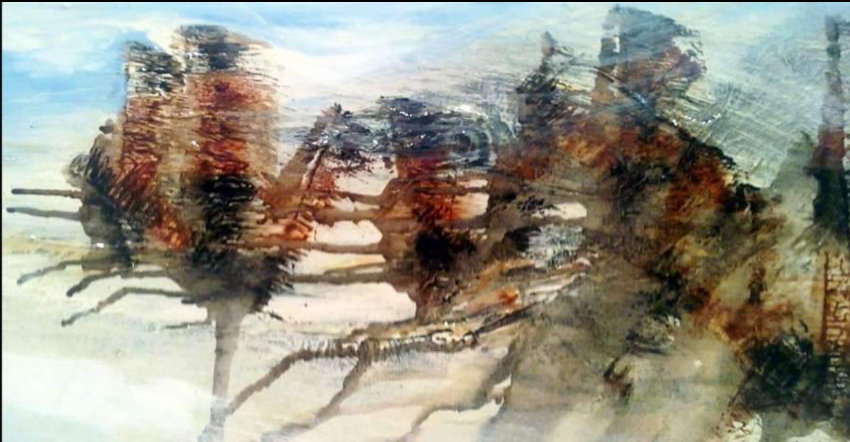
6. Agua y Gaviota Óleo y Mixta s/lienzo - Oil and Mixed on canvas 100 x 0,40 cm.