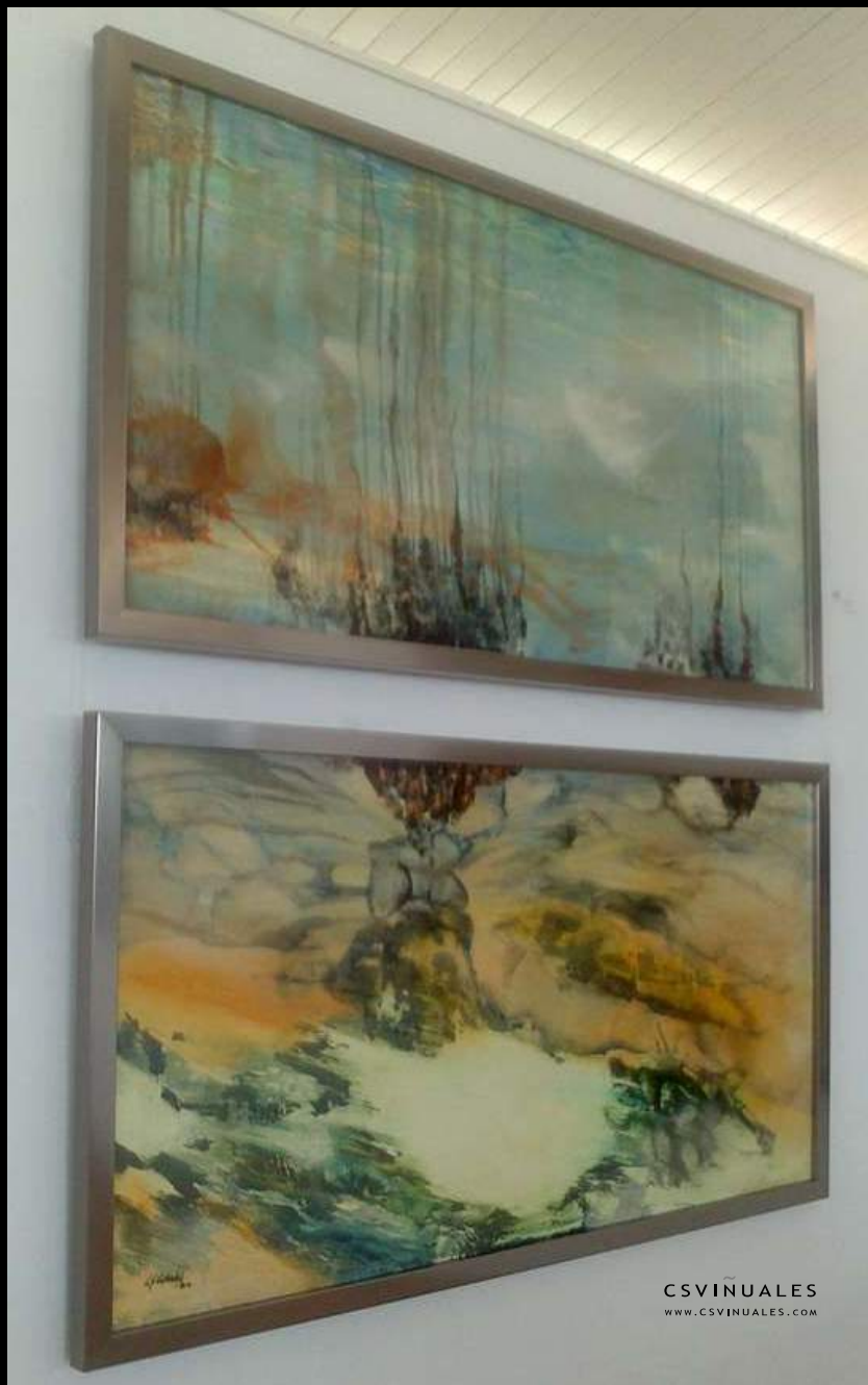
10. Agua I (díptico) Óleo s/madera - Oil on wood 122 x 61 cm. cada pieza