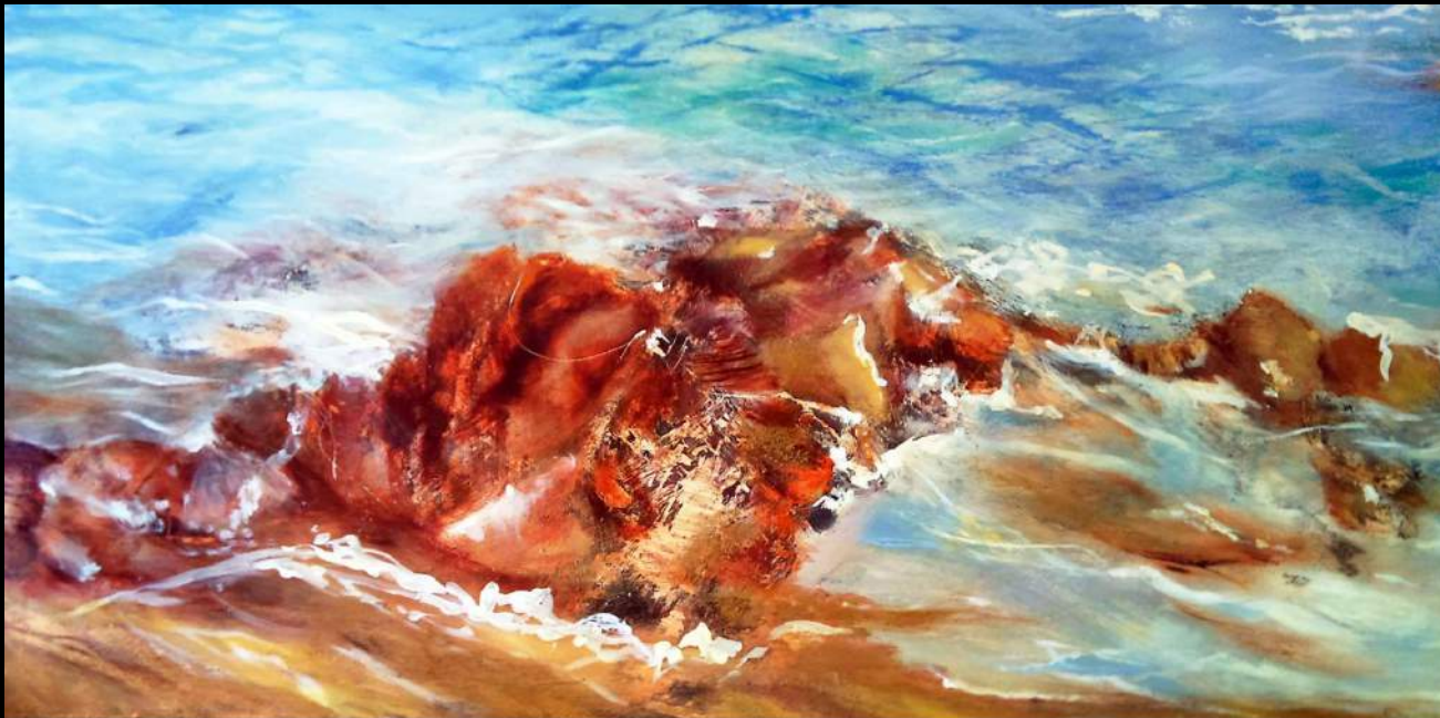
9. Gaviota I (díptico) Óleo s/madera - Oil on wood 122 x 61 cm. cada pieza