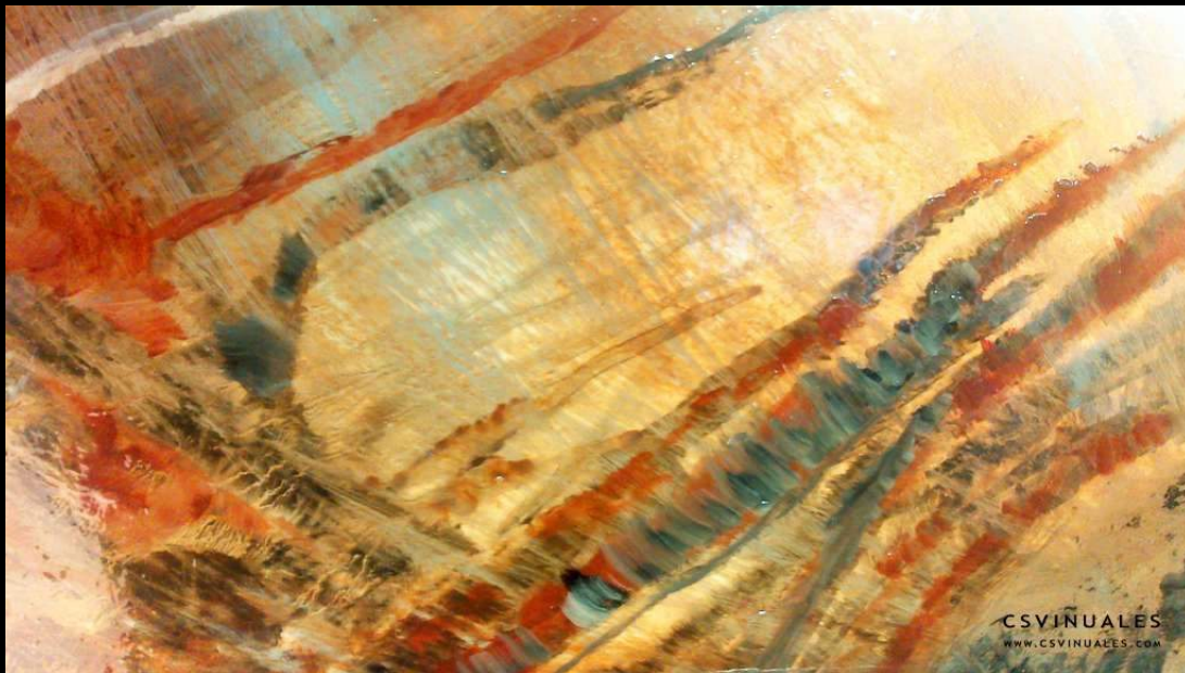
4. Agua IV Óleo s/madera - Oil on wood 0,50 x 0,40 cm.